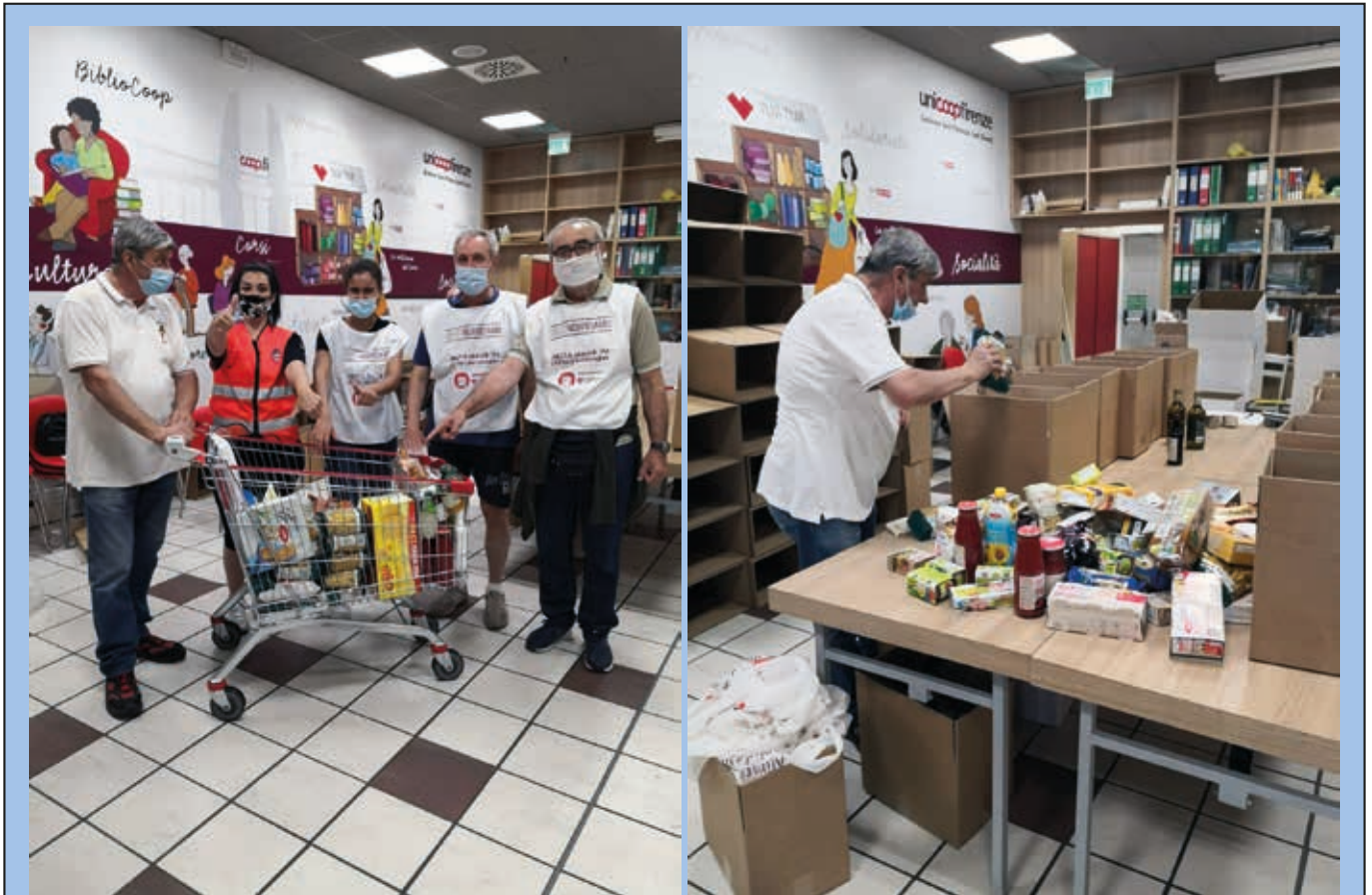
4 luglio: raccolta alimentare straordinaria organizzata da UNICOOP. I nostri volontari impegnati nel centro commerciale di Ponte a Greve