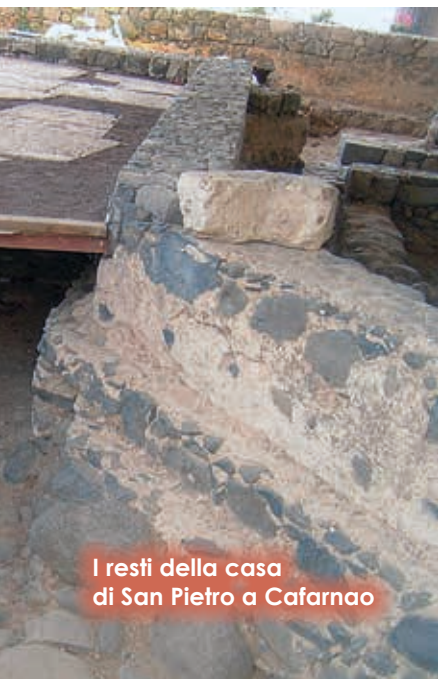
I resti della casa di San Pietro a Cafarnao