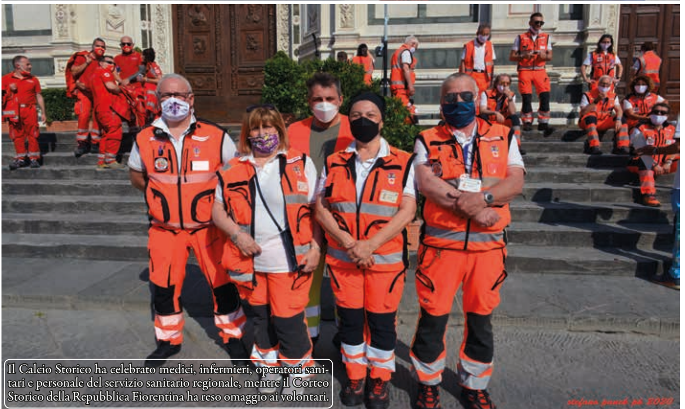
Il Calcio Storico ha celebrato medici, infermieri, operatori sanitari e personale del servizio sanitario regionale, mentre il Corteo Storico della Repubblica Fiorentina ha reso omaggio ai volontari.