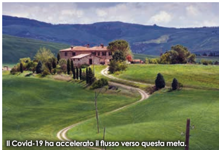
Il Covid-19 ha accelerato il flusso verso questa meta.

Perché moltiplicare tutto - Come abbiamo visto, la