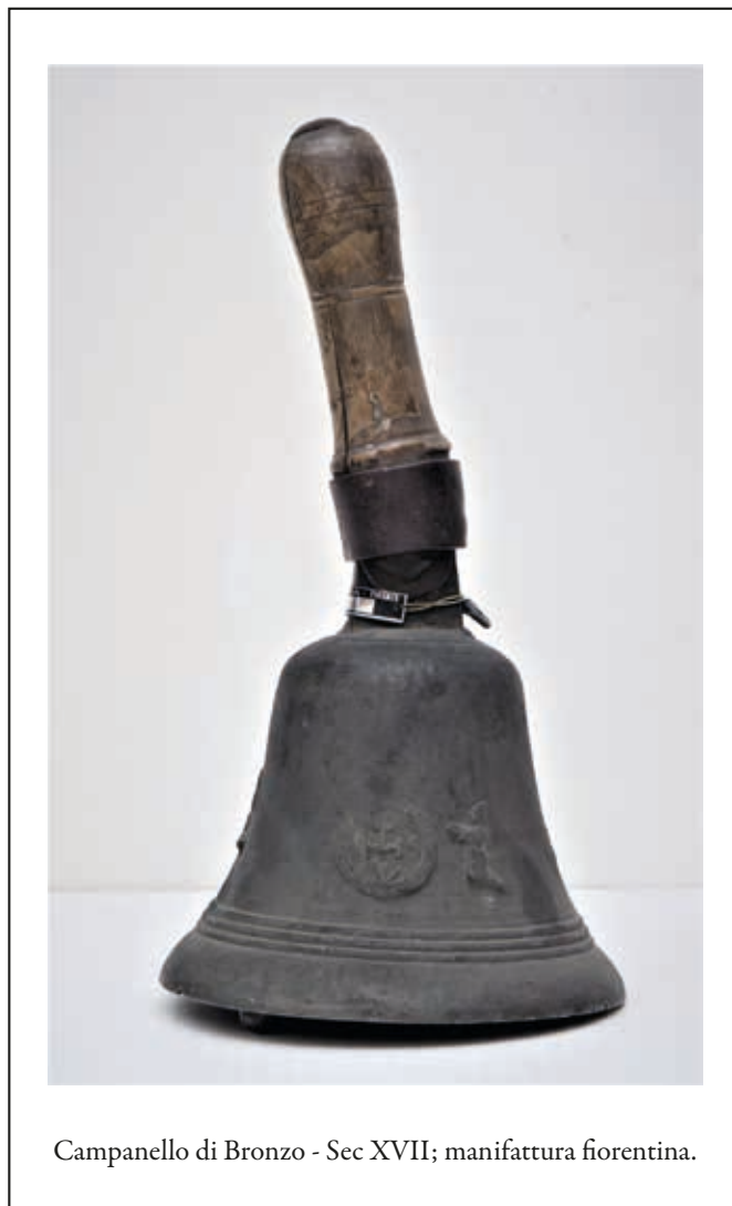
Campanello di Bronzo - Sec XVII; manifattura fiorentina.

sirena ed il suo urlo lacerante implora “aiuto” ed esige “via libera”. Il traffico per un istante è interrotto, i cittadini si scoprono riverenti... passa la Misericordia, vola l'autoambulanza, guidata dall'impareggiabile autista!” L'assistenza ai condannati che per tanti secoli fu svolta dalla Compagnia di Santa Maria della Croce al Tempio, detta de' Neri, fu assegnata alla nostra Arciconfraternita quando la pena di morte, dopo una breve soppressione, fu ripristinata. Anche in quei casi i Fratelli che accompagnavano i condannati al patibolo avevano un campanello, che forse apparteneva proprio alla Compagnia de' Neri, che usavano per farsi largo e se in questo caso non c'era il problema del contagio, cercavano di tenere lontani i curiosi ed i ragazzi che talvolta si divertivano a dileggiare gli stessi condannati. Direi che era ed è una forma di rispetto oltre che per il servizio in sé che deve svolgersi nel miglior modo possibile, anche nei confronti di quei Fratelli che, “ senza alcuno prezzo o premio ”, dedicano parte del loro tempo, rischiando anche la vita, per aiutare chi ha bisogno di aiuto.