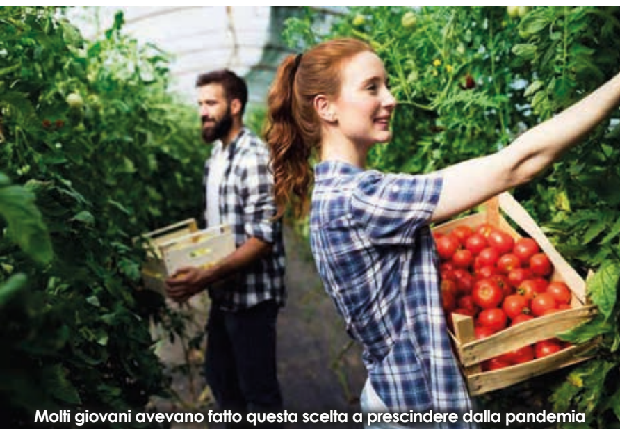
Molti giovani avevano fatto questa scelta a prescindere dalla pandemia

qualità della vita fuori dai centri urbani è sensibilmente migliore rispetto a quella di città e soprattutto meno stressante, lontano dalla folla e da vicini impiccioni. Vivere in zone di campagna può offrire una sensazione di privacy e di tranquillità altrimenti inafferrabili. La campagna è un ambiente molto apprezzato anche dai bambini che possono scorrazzare felici senza correre troppi rischi. Oltre all'inquinamento atmosferico la campagna tende a tenere lontano anche quello acustico con grande ristoro delle nostre orecchie e della nostra psiche.