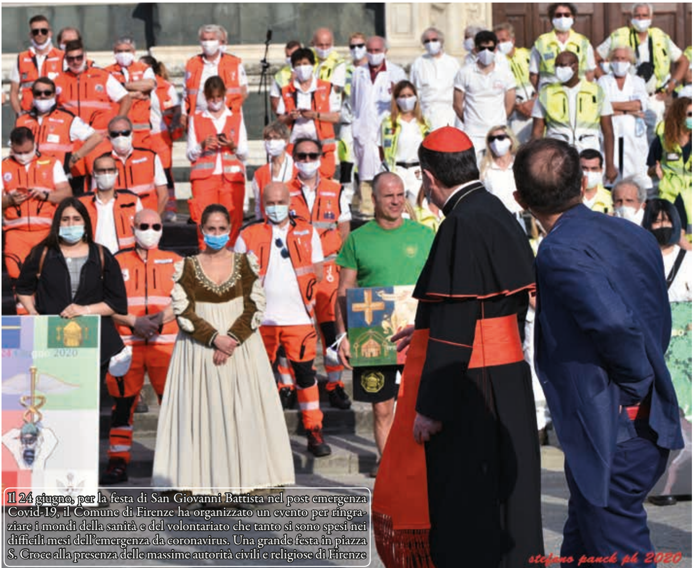
Il 24 giugno, per la festa di San Giovanni Battista nel post emergenza Covid-19, il Comune di Firenze ha organizzato un evento per ringraziare i mondi della sanità e del volontariato che tanto si sono spesi nei difficili mesi dell'emergenza da coronavirus. Una grande festa in piazza S. Croce alla presenza delle massime autorità civili e religiose di Firenze